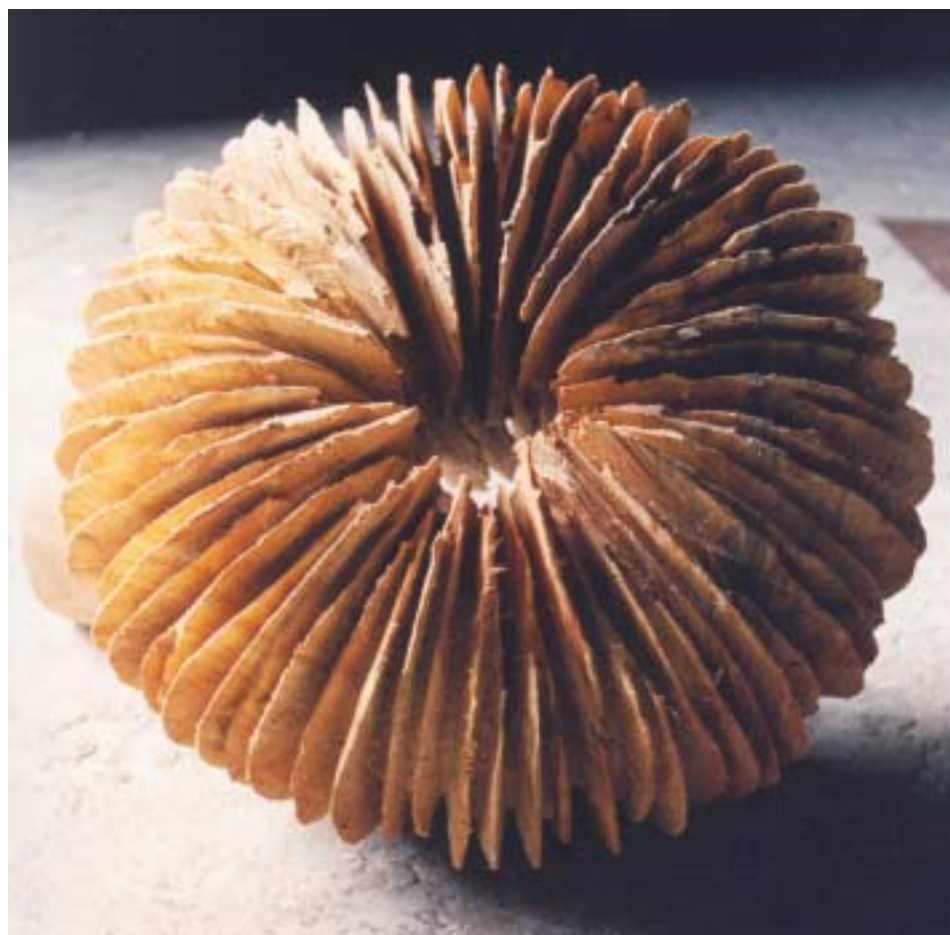
SEA-CHANGE, sculpture sur bois, 50 x 50 x 50cm

Leurs créations chantent, ensemble, juste, et le coeur les accueille.